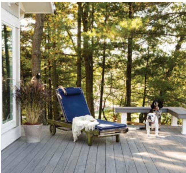
Dekor Silver Maple