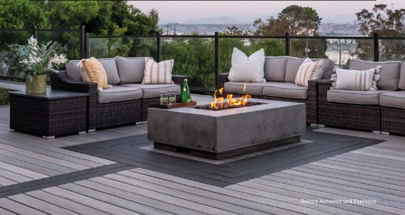
Dekore Ashwood und Espresso

NACHHALTIG - in den USA aus ca. 85% Recyclingmaterial hergestellt