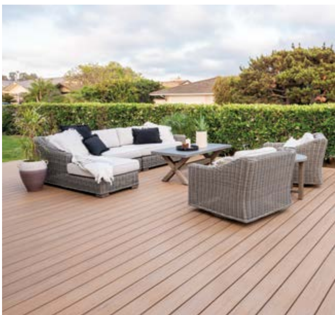
Dekor Antique Leather®